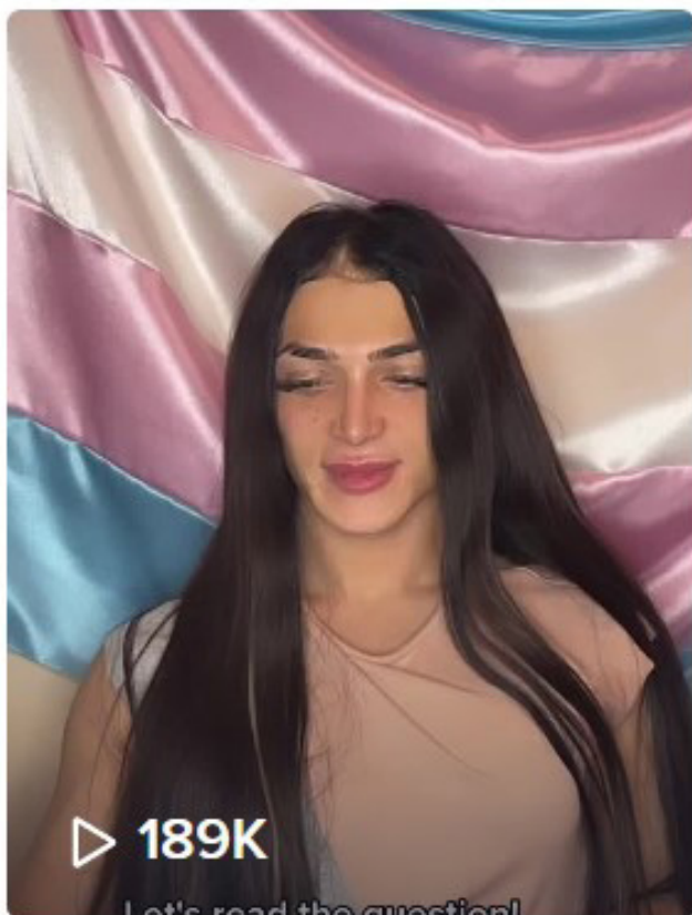
#pride #trans ...

И это в очередной раз показывает, что не стоит бояться использовать новые площадки и возможности в своей работе.